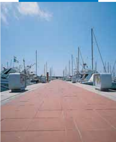
Новый порт в Чивитавеккье: укладка терракотовой наружной напольной плитки с помощью Keracrete

При укладке стеклянной мозаики на бумажной основе, особенно светлых тонов, следует пользоваться Keracrete с белым порошком Keracrete Powder White .