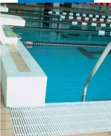
Пример использования Keracrete и Keracrete Powder для укладки мозаики в плавательном бассейне