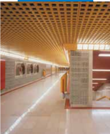
Пример укладки панелей из гранитной крошки в метрополитене - 3-я ветка - Милан (Италия)