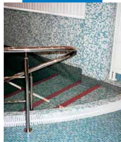
Пример укладки стеклянной мозаики