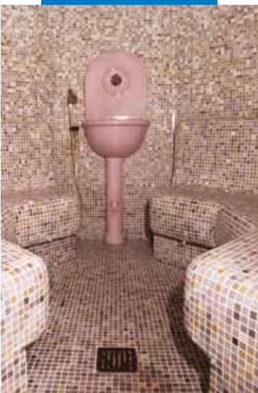
Пример укладки в турецкой бане стеклянной мозаики с помощью Keracrete и Keracrete Powder - Гостиница "Парк Отель Гритти" - Бардолино (Область Вероны)