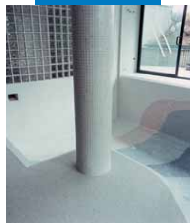
Пример укладки мозаики