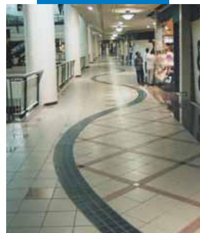
Пример укладки керамической плитки в коммерческом центре – Филинвест Фестивал Суперхол – Манила (Филиппины)